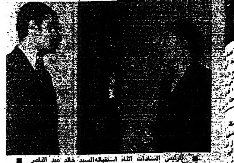
الرئيس السادات أثناء استقباله السيد خالد عبد الناصر